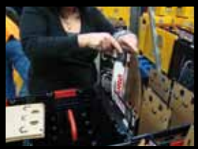
Christine introduit un pack ouvert dans les bacs noirs