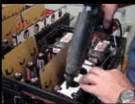
Carine ferme et colle le pack