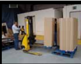
Il est ensuite placé sur une palette