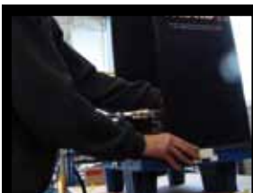
Pascal les monte