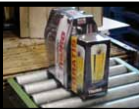
Et se retrouve emballée avec un verre et cinq bouteilles