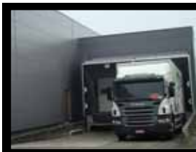
Tauro arrive au Village avec des milliers d'autres bouteilles

Me trouver dans votre frigo, cela vous semble évident. Mais pour y arriver, j'ai fait un long voyage. J'ai vu beaucoup de visages et je suis passée entre de nombreuses mains. Embarquez! Destination le Village n°1.