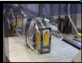
Tauro est entourée de film