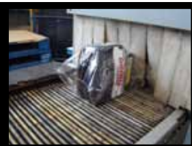
Elle passe sous un tunnel de chaleur