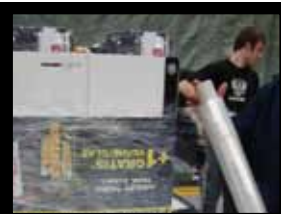
Le display complet est filmé