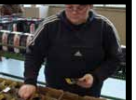
Et glisse des bons dans les verres