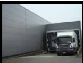
Avant de poursuivre son voyage vers votre supermarché...