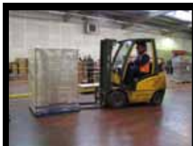
Carl transporte la palette complète jusqu'au stock