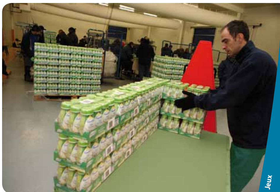
La chambre froide à Noucelles 2