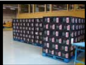
Tauro attend près de la chaîne n°2